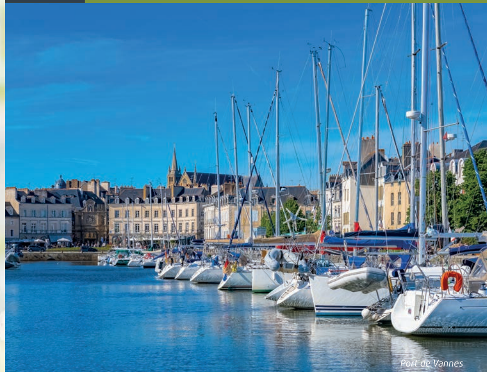
Port de Vannes