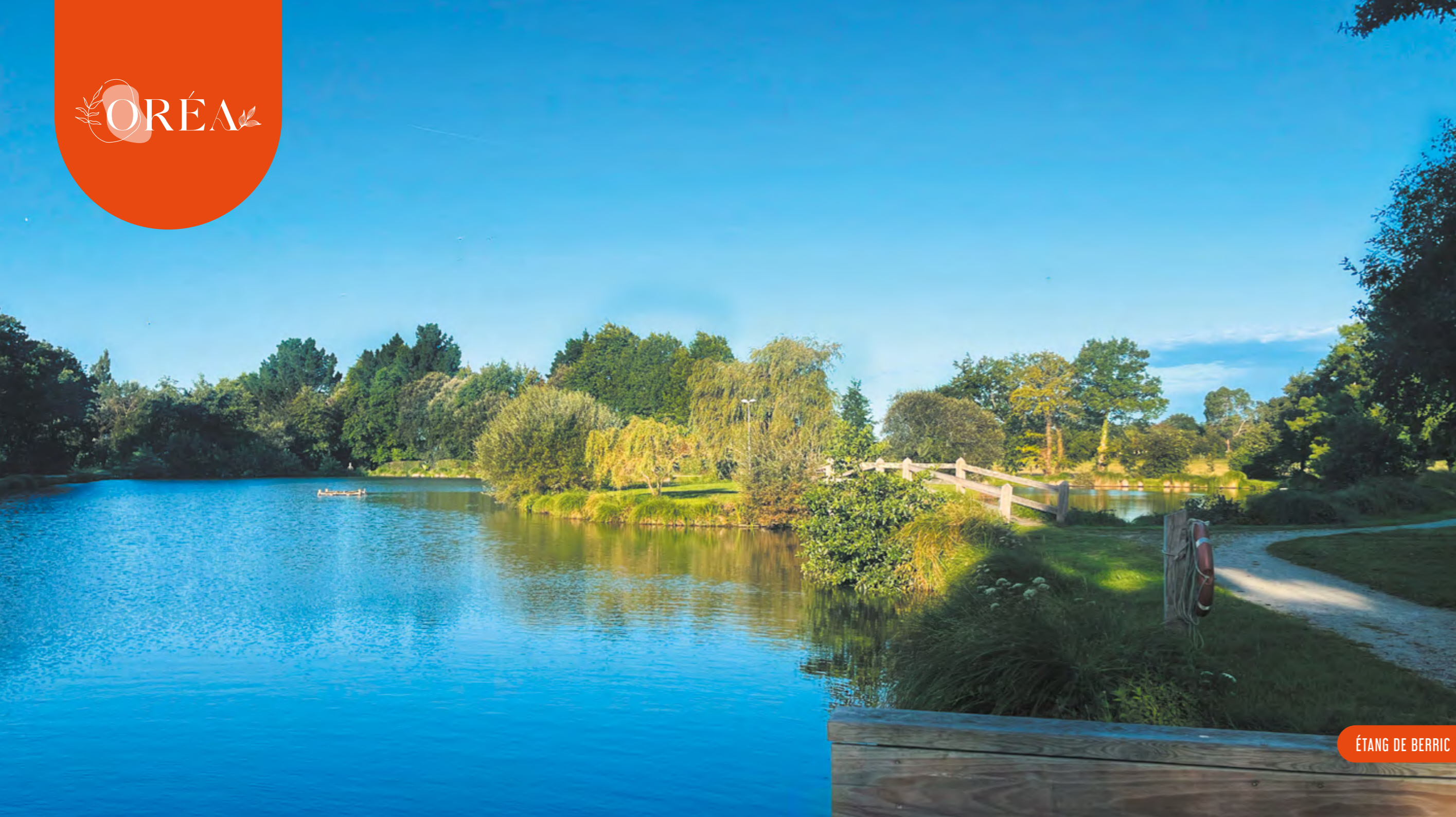
ÉTANG DE BERRIC